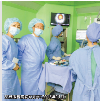
聖母眼科病院を見学(2016年11月)