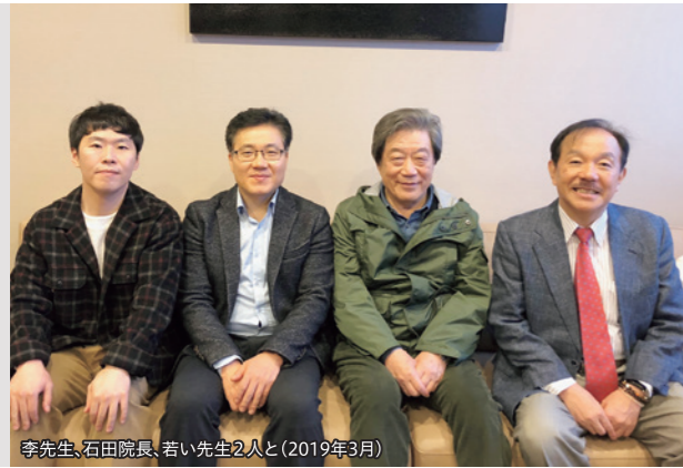
李先生、石田院長、若い先生2人と(2019年3月)