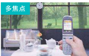
近くと遠くの両方にピントをあわせることができます