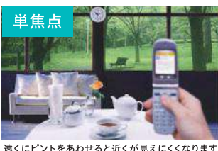
遠くにピントをあわせると近くが見えにくくなります

ズですが、設計が複雑なため、メリットだけでなくデメリットもあり、性質を良く知っておく必要があります。