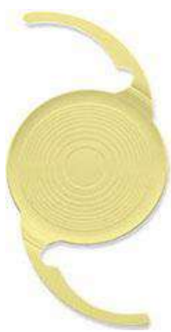
AMO社 シンフォニー テクニス

●「先進医療実施施設」以外でこの手術を受ける場合は手術費用のみならず手術前後の診察費用すべてが自費負担となります。